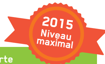
Tableau 1 - Résultats de l'APQ au programme de l'Alliance verte

L'APQ est ainsi devenue la première administration portuaire à atteindre cette performance exceptionnelle parmi les 35 administrations portuaires membres de l'Alliance verte.